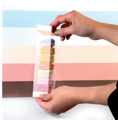
5 > Mise en place de l'insert carton de fermeture