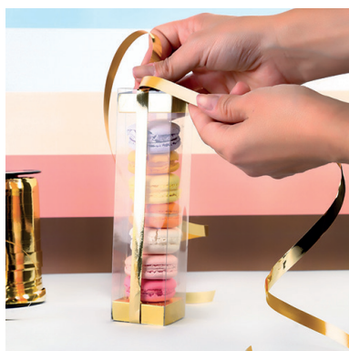
7 > Habillage de l'étui et présentation