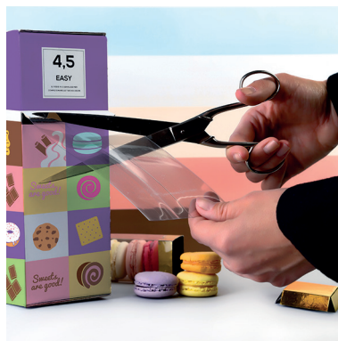
2 > Découpe à la longueur souhaitée