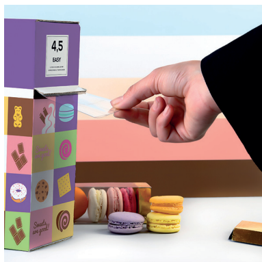
1 > Prise de la bobine