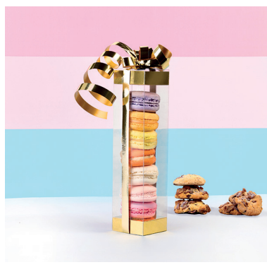
8 > Produit fini