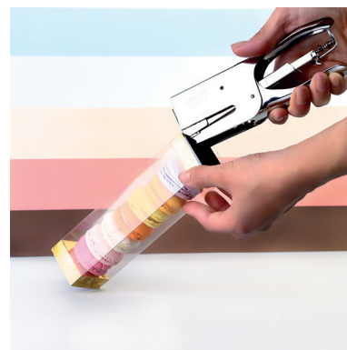
6 > Verrouillage des inserts