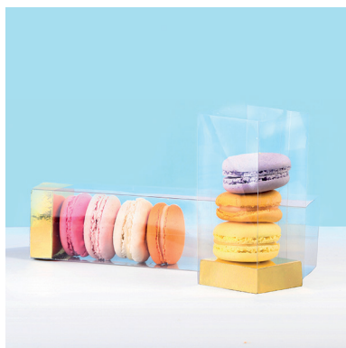
4 > Insertion des produits